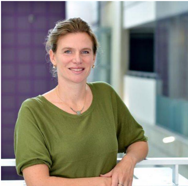
Η Mariana Mazzucato, καθηγήτρια Οικονομικών της Καινοτομίας στο Πανεπιστήμιο του Σάσεξ